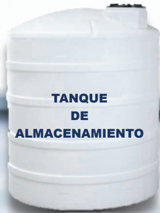
TANQUE DE ALMACENAMIENTO