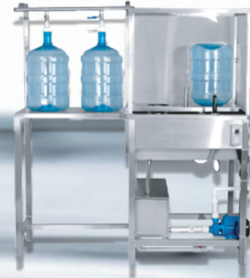
LAVADORA Y LLENADORA