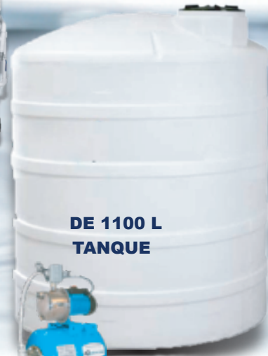
DE 1100 L TANQUE